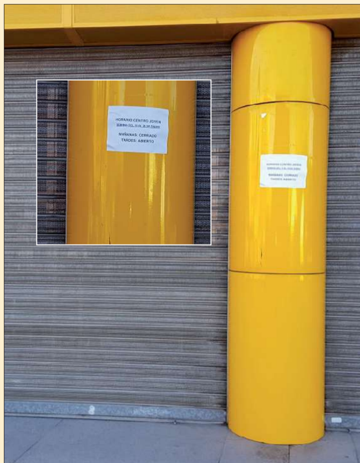
El Centro Joven, cerrado.

El Grupo Municipal Socialista ya presentó en 2016 una moción, que fue apoyada por todos, para comenzar los trabajos de elaboración de un nuevo Plan de Juventud, en el que deberán participar agentes juveniles, profesionales del sector, asociaciones, colectivos y también centros educativos, con el fin de que sea un documento consensuado, realista y transformador. El plazo fijado para su aprobación sería el primer semestre de este año, lo que permitiría ponerlo en marcha inmediatamente después. Por