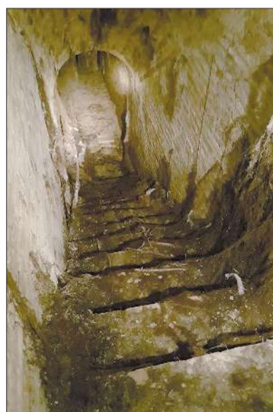
Puerta de acceso al refugio, en La Carrera (i), y escalera interior.